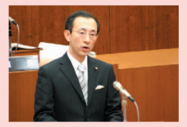
市民創政会代表質問