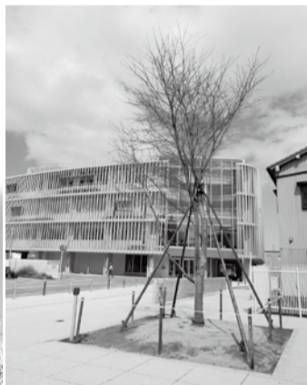
▲取り木して高さ約10mに育ち、3月21日に移植された二代目百年桜=3月27日、あおーよ前=

正午から明日の法福寺。法要の後、国の重要無形民俗文化財の稚児舞を奉納。境内の樹齢430年のエドヒガンザクラは富山県の天然記念物です。なお午後2時から、伝統の柴燈護摩(野外で行う大きな護摩法要)が開催されます。(問合せ/法福寺 ☎65-0526) ※恒例の百年桜を観る会、黒部の桜めぐり、阿古屋桜まつりは3月31日に終了しました。