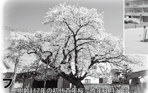
樹齢117年の初代百年桜=昨年3月31日=

市役所横の百年桜は樹齢117年のソメイヨシノで、黒部市の天然記念物であり、富山さくらの名所70選にも選ばれています。14日まで、午後6時から同10時までの間、ライトアップされます。(主催/旧三日市小学校の百年桜を愛する会・三日市自治振興会 ☎54-0278)