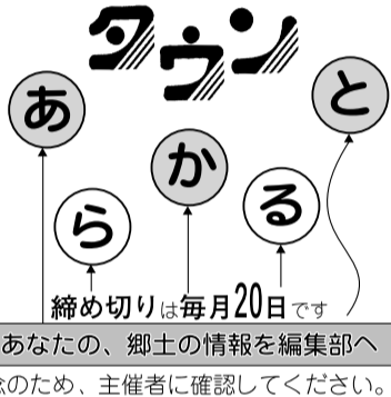
あなたの、郷土の情報を編集部へ 念のため、主催者に確認してください。

■4月の魚の駅「生地」(☎57-0192) (1)とれたて新鮮朝市 7日午前8時から。朝市定食(800円)などを特売。(2)感謝デー 14日。とれたての魚などを特売。